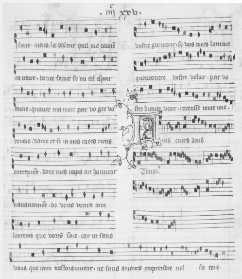
Seite aus der Handschrift fr 1584 (Motette 11 Ausschnitt) Page manuscript Motet 11 (excerpt)

Ausgangspunkt der Komposition "Amer - Tänze im Labyrinth" von Lukas Langlotz sind die Motetten 1 - 17 des französischen Dichter-Komponisten Guillaume de Machaut (ca. 1300 - 1377). Es geht darin um unterschiedliche Berührungsebenen mit einem Wort-Ton-Komplex, der eine große Interpretationsvielfalt zulässt. Langlotz schafft in seinem Werk verschiedene Grade der Nähe und Distanz zu Machaut, die Paletten reich von der Bearbeitung bis zur Neukomposition. Bewusst verzichtet er auf die Mitwirkung von Singstimmen, obwohl es sich bei den Motetten um Vokalkompositionen handelt. So wird mit einem modernen Instrumentalensemble etwas Neues ge-