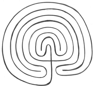
kretisches Labyrinth mit 7 Umgängen Cretan labyrinth with 7 round walks